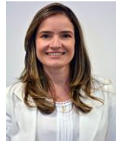
COORDENAÇÃO Karina Costa Tate & Lyle